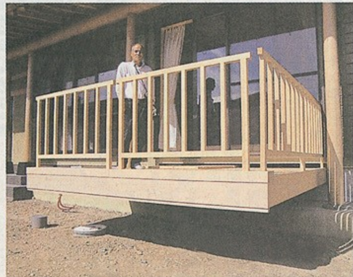
電動の床下収納式ウッドデッキ。手動タイプもある 川南町

長友代表は「これからは 何か特技がないと生き残れ ない。将来的には電動門 扉、収納デッキだけの販売 も検討したい」と話してい る。 同社 ☎0985(75) 4 728。