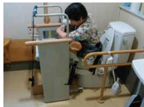
適宜な角度の排泄環境で座位保持しプライバシーを守り自立支援します。