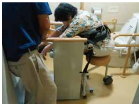
数秒で車椅子の役割になります。 多少の段差・360°方向移動可能。