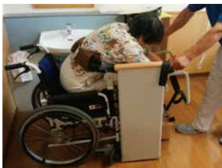
FSは、車椅子に乗ったままで足を 乗せ換えられる事無く移乗が出来ます。